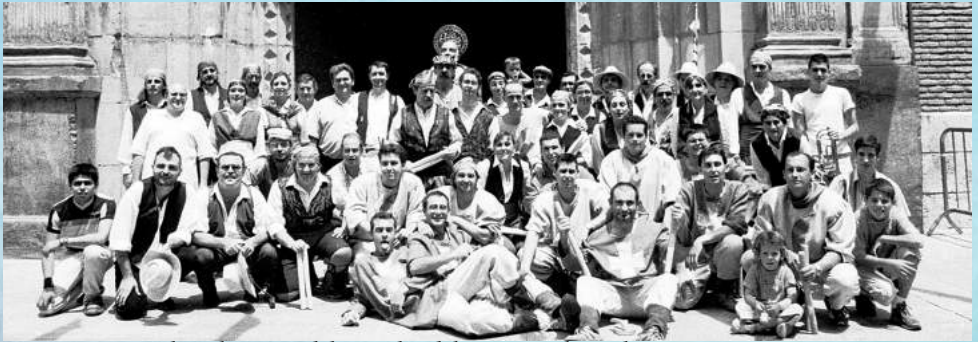
Exposición sobre el Danze del Gancho del 22junio al 30julio en AVV Lanuza Casco Viejo

Si algo diferencia el Danze del barrio del Gancho de Zaragoza de cualquier otro es el propio origen del baile y de la agrupación. En primer lugar, no se trata de un dance tradicional, sino de un 'neodance', de mudanzas creadas ex novo a partir de música tradicional e inspirado en la raíces del folclore ancestral. Pero además, la agrupación surgió a partir de las propias realidades y de las necesidades de las que adolecía el entonces castigado barrio del Casco Histórico.